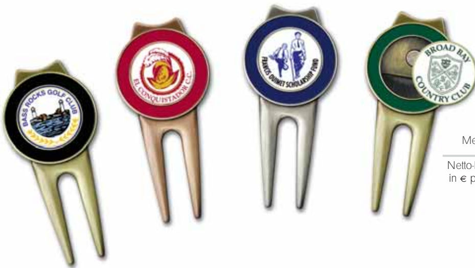
DT 500 Spectrum Matt Nickel, Matt Gold, Matt Kupfer