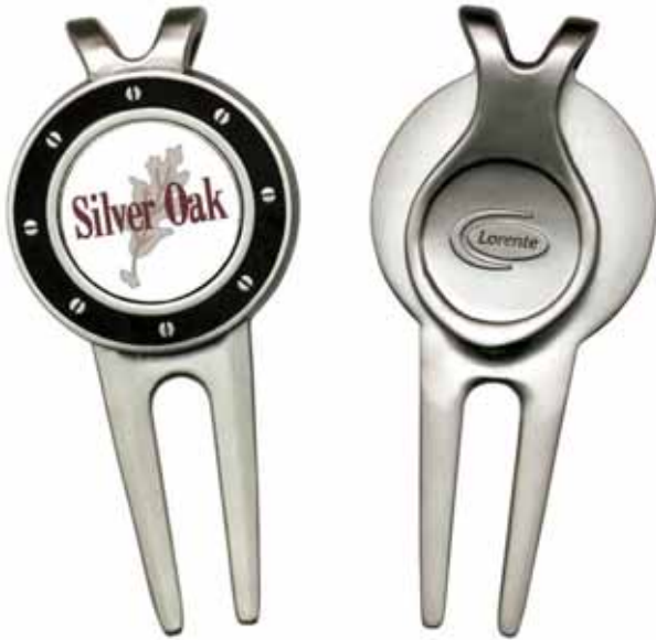
DT 950 Monza mit Gürtelclip. Erhältlich in Nickel oder Goldton