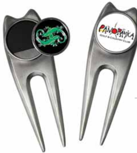
DT 400 Minuteman Antik Nickel