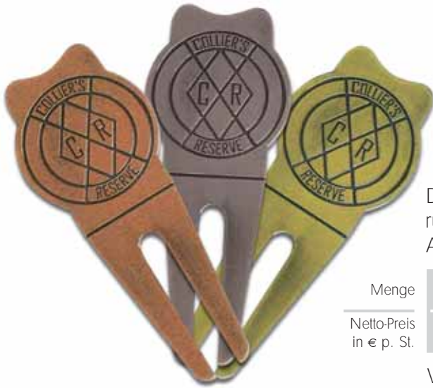
DT 180 runde Pitchgabel, mit geprägtem Logo Antik Gold, Antik Silber, Antik Kupfer