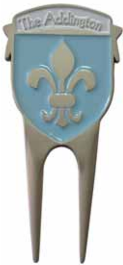
DT 300 ohne Gürtelclip