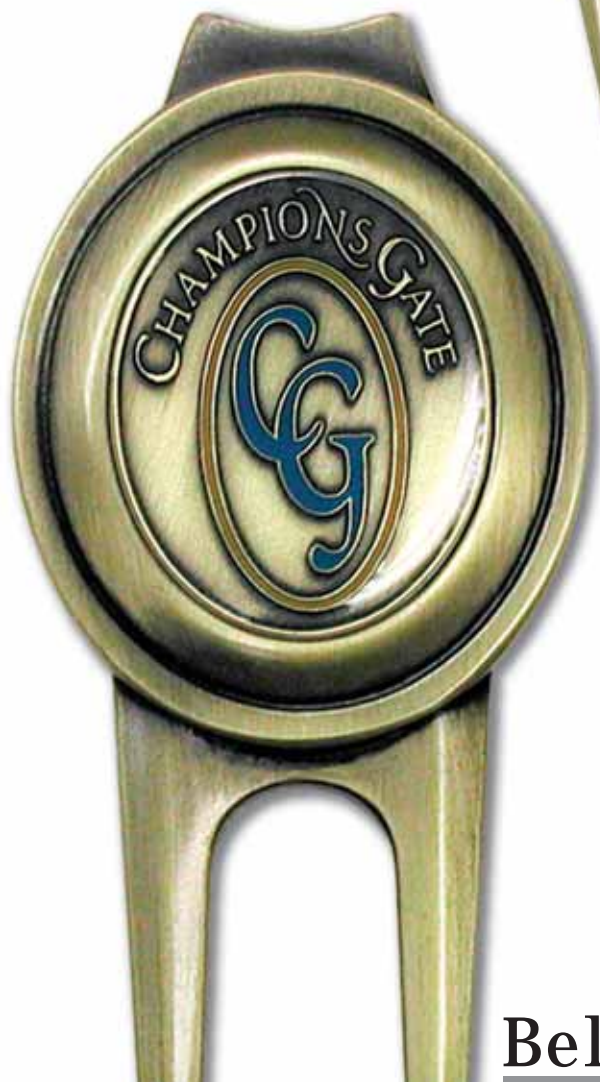
DT 370 Firebird ohne Gürtelclip Mit zwei Ballmarkern