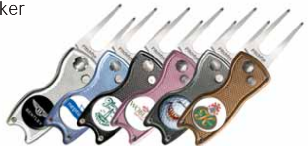
silber hellblau schwarz rosa grau gold