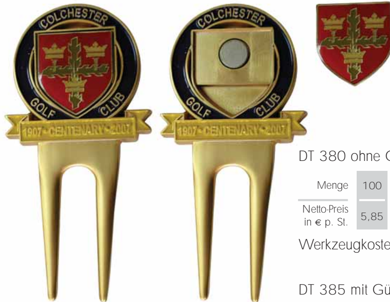
DT 380 ohne Gürtelclip